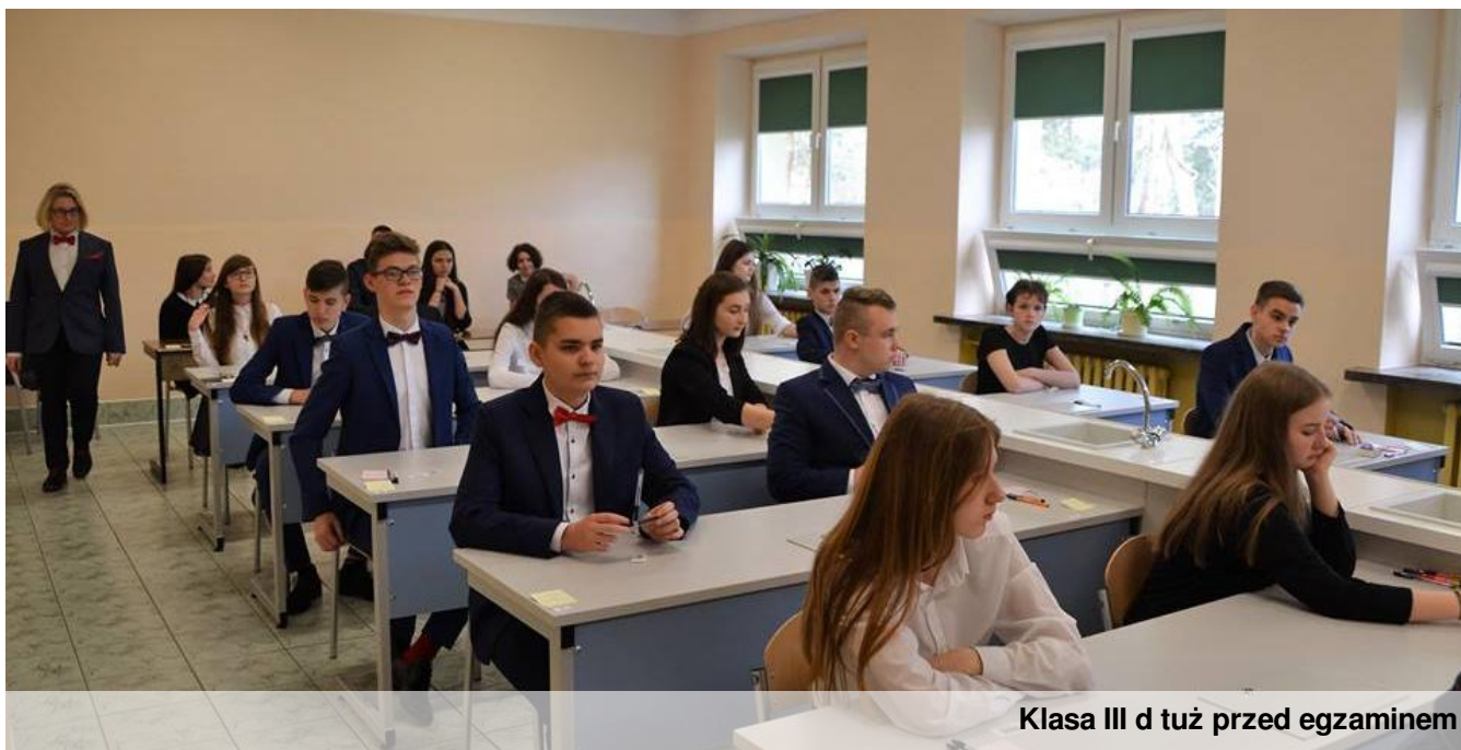
Klasa III d tuż przed egzaminem